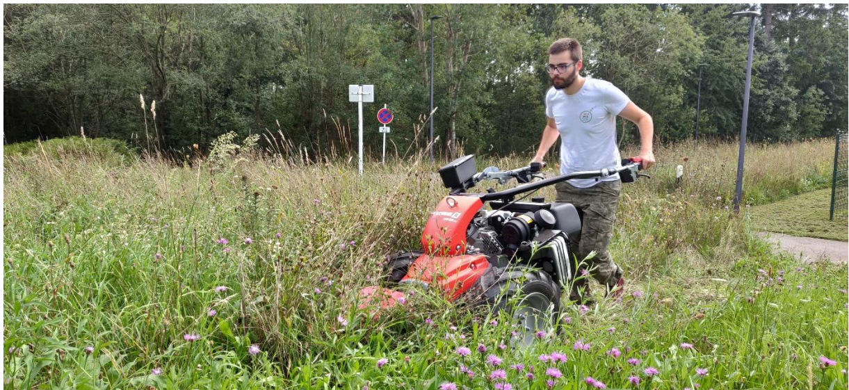
Beschreibung: Balkenmäher am Asaz.

Méimethod. Wéi uewen ugedeit ass d'Méimethod och e wichtege Faktor. Bei de wuel gängegste Méimaschinnen am Privatberäich, déi sougenannt Mulcher (d.h. Sichelmulcher, och "Mulchrasenmäher" genannt, a Schlegelmulcher) ginn déi meescht Insekten, déi sech an der Fuerspuer befannen, ugesaugt a futti gemaach. Fir dësem Effekt entgéintzewierken, kann een d'Schnëthéicht op de Maximum astellen (oder sou wäit vergréissere, wéi d'Notzung et zouléisst). Méi insekteschouend Méigeschier sinn zum Beispill e "Balkenmäher", e "Freischneider" mat "Dreiecksmesser"- oder "Kreuzschere"-Opsaz oder eng Séissel.