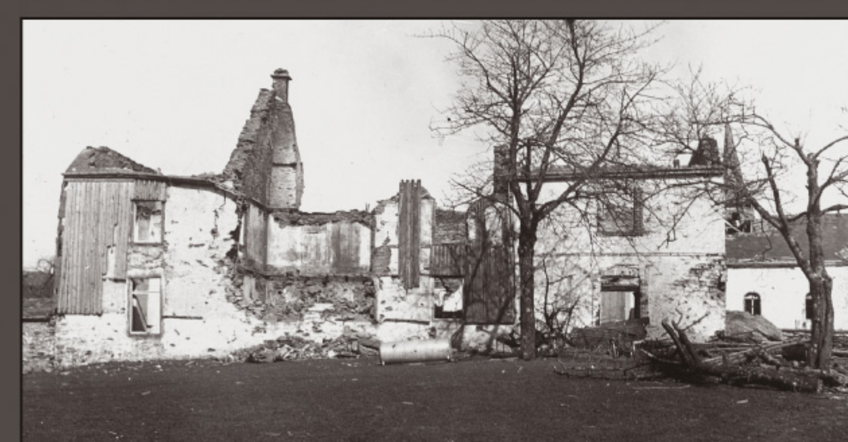
WEILER, 1945, northern and southern front of the village-hall in ruin (school, teacher's lodgings, dairy, fire-brigade's hangar, assembly room with stage)