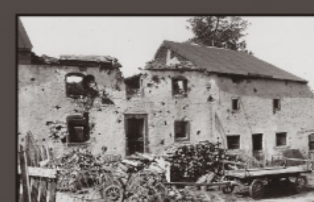
Nachtmanderscheid, May 1946