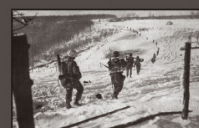
Near Houschterhaff, 24.01.1945