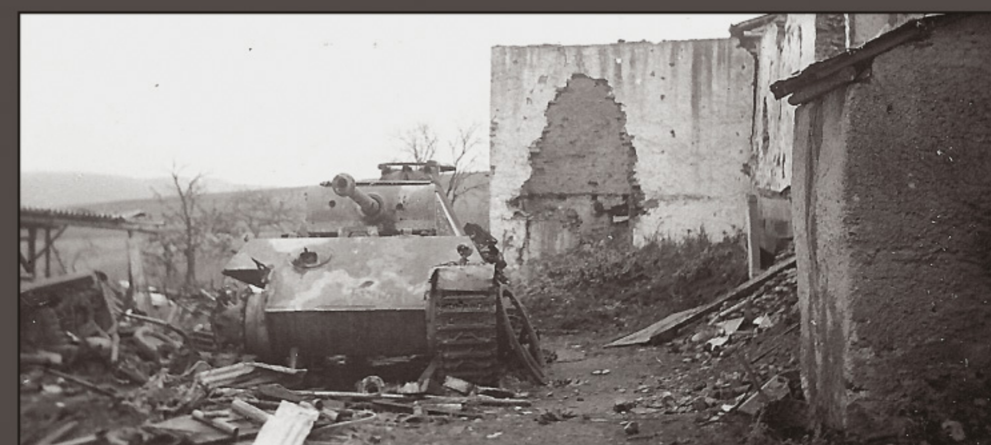
Putscheid, Oct. 1945, "Panther" tank near house Nosbusch