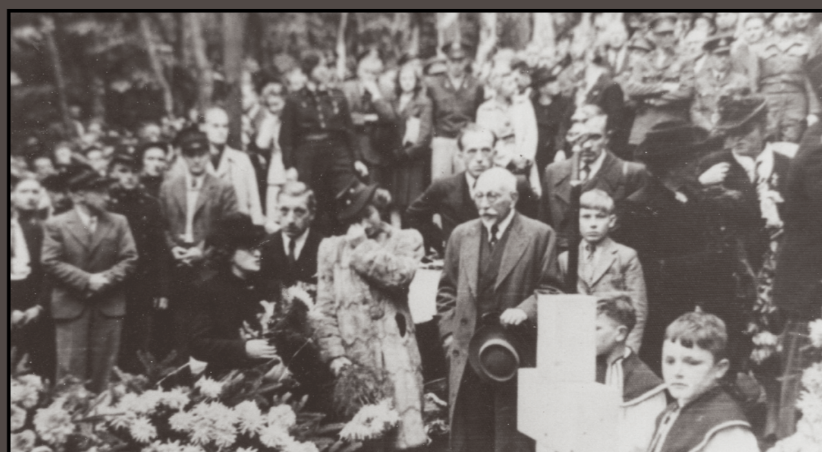
Official burial of the six allied servicemen