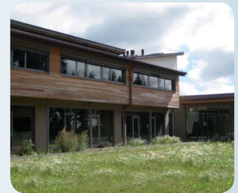
Das Haus des Naturpark Our

Auf ruhigen Nebenstraßen geht es dann hinauf auf die Anhöhen von Wahlhausen. Von dort aus hat man eine weite Aussicht über die gesamte Umgebung (6 km). Nachdem man die kleine Ortschaft hinter sich gelassen hat geht es bald auf schattigen Waldwegen entlang des „Bollersbaach“ hinab ins Tal des „Huschterbaach“ (9 km), dem man bachaufwärts durch Wald und Wiesen folgt um wieder nach Hosingen zu gelangen.